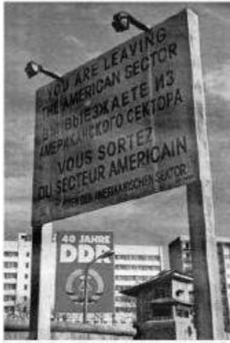
Próxima às ruínas do Muro de Berlim, está preservada uma placa com o seguinte aviso em inglês, russo, francês e alemão: "Você está deixando o setor americano".